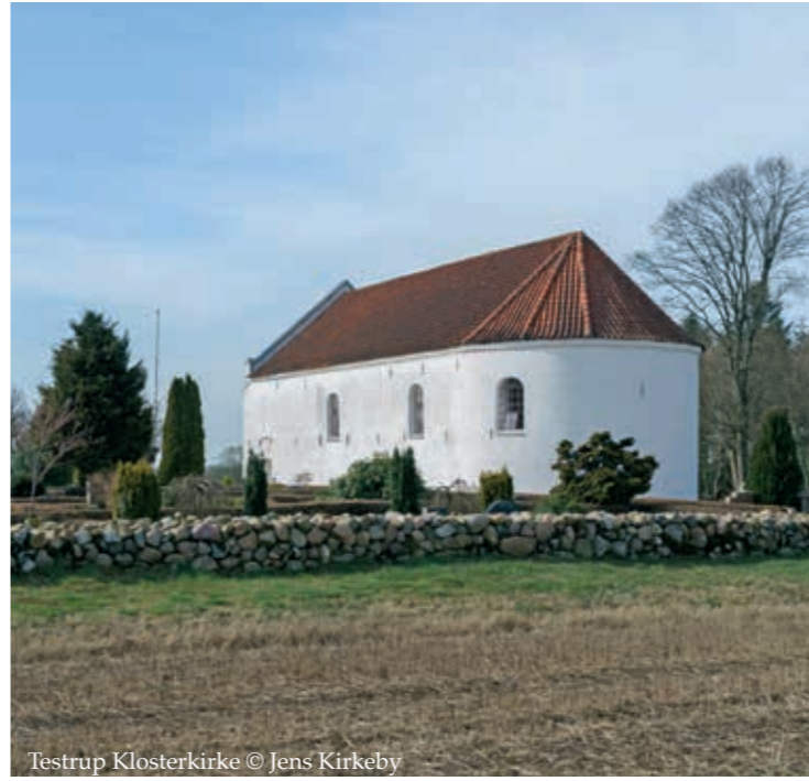
Testrup Klosterkirke

Testrup: kirke, hospital og kilde. [27] Den nuværende Testrup Kirke består af koret med apsis fra en langt større gotisk korskirke, som Viborg bispens lod bygge i 1430-erne sammen med et hospital. Ruinerne ved kirken kaldes for Testrup Kloster - men det er resterne af hospitalet. Ved foden af en bakke nordost for kirken springer Skt. Søren's Kilde, der i middelalderen var mål for stor valfart.