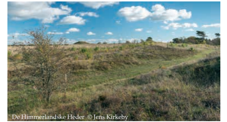
De Himmerlandske Heder

The Heaths of Himmerland. [24] The last remnants of a large interconnected heath area between the Limfjord and Rold Skov (Rold Forest) with burial mounds and numerous ancient road tracks. The most beautiful Stone Age vessel of the North - Skarpsalling Karret (The Skarpsalling Pot) - originates from one of these mounds.